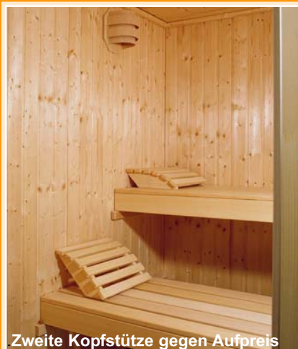
Zweite Kopfstütze gegen Aufpreis