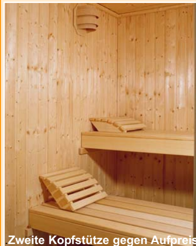
Zweite Kopfstütze gegen Aufpreis